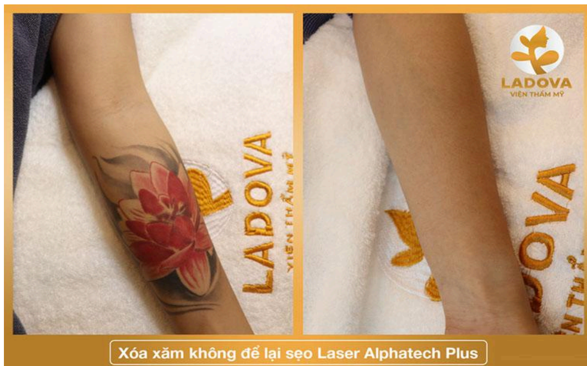
Xóa xăm không để lại sẹo Laser Alphatech Plus

dịch vụ thẩm mỹ nhận được nhiều phản hồi tích cực cũng như lựa chọn của nhiều người khi đến với Ladova.